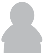
共同合作家 庭法律師